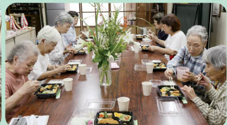
7月の花はハマユウ、クチナシ、ヒメヒオウギスイセンなど……