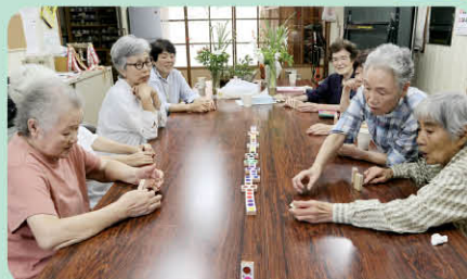
色合わせドミノを楽しんでいます